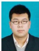
建行抚顺分行 普惠金融事业部