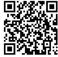
商务权力事项清单